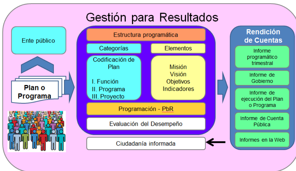
Figura No. 1 Subsistema del PbR y el Sistema de GpR

Adoptar el modelo de cultura organizacional, directiva y de gestión con énfasis en los resultados, propicia que las acciones se orienten hacia el cumplimiento de los objetivos para otorgar a la población respuesta a sus necesidades o demandas presentes y futuras, aplicando los conceptos de la Gestión para Resultados ( GpR ), permitiendo la distribución de recursos de manera eficiente y eficaz.